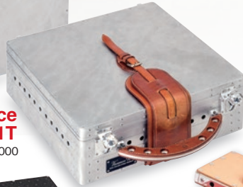
Vacance P911T ¥650,000