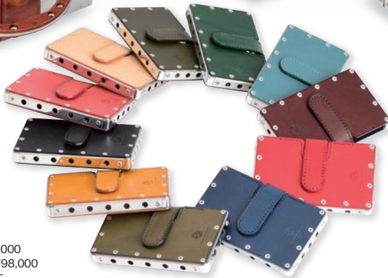
Card Case Emijah EM-10 ¥28,000