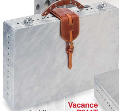
Trunk Case Vacance P911T ¥650,000